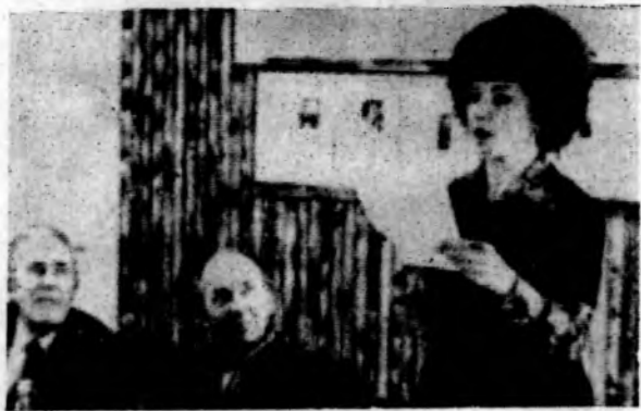
● Встреча в редакции